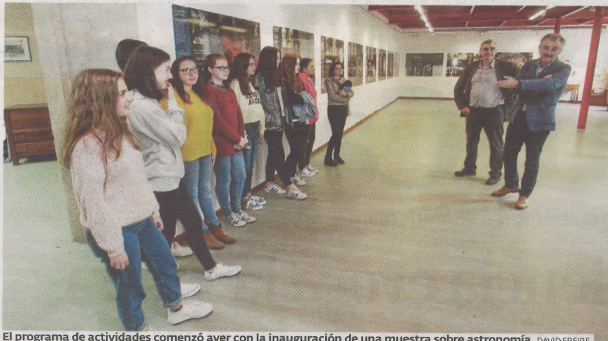
El programa de actividades comenzó ayer con la inauguración de una muestra sobre astronomía. DAVID FREIRE