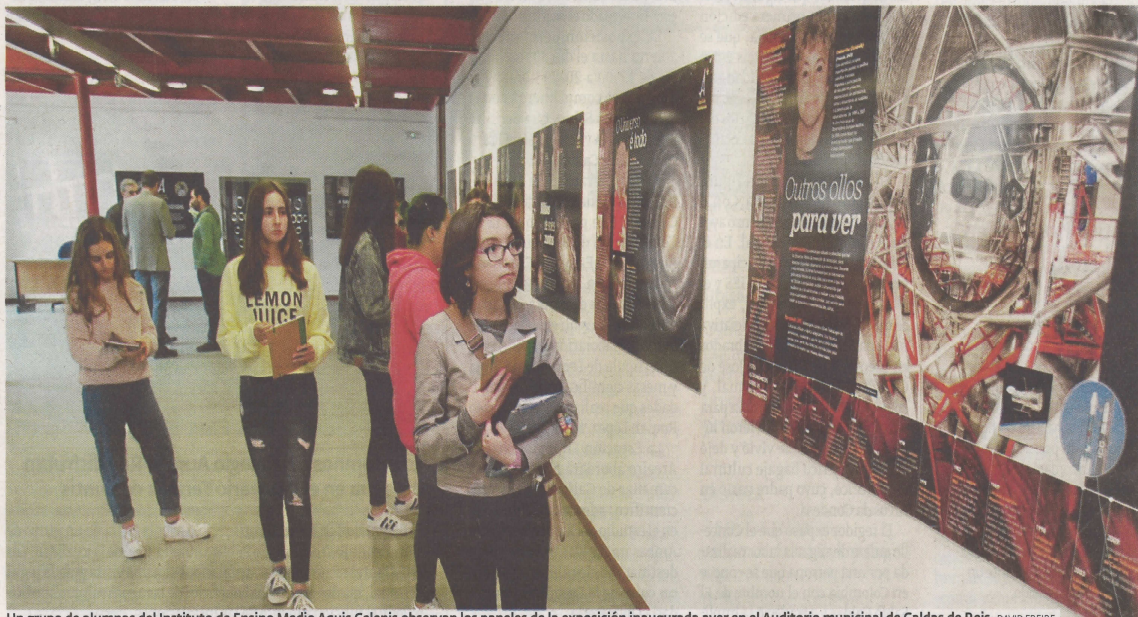
Un grupo de alumnas del Instituto de Ensino Medio Aquis Celenis observan los paneles de la exposición inaugurada ayer en el Auditorio municipal de Caldas de Reis.

Caldas es la protagonista de un evento que fue organizado con el objetivo de divulgar la obra del científico, conocido en Colombia con el nombre de El Sabio Caldas, cuyo padre nació en Arcos da Condosa. >02