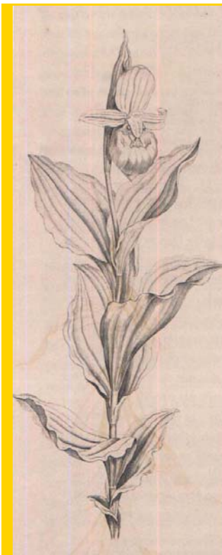
La orquídea Cypripedium (segunda parte de The Botanic Garden de Erasmus Darwin).