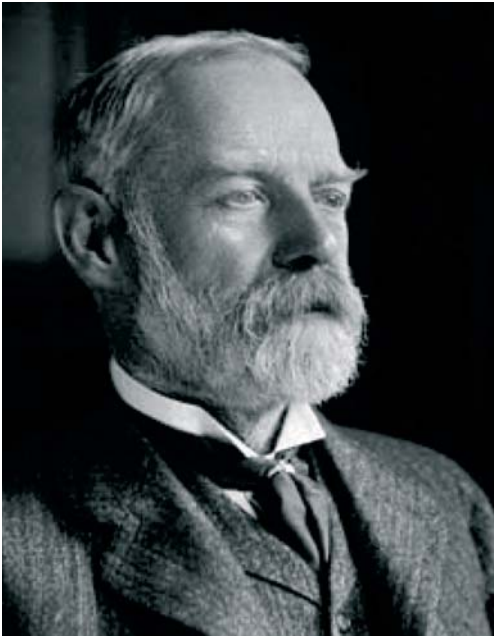
George Darwin (1845-1912).