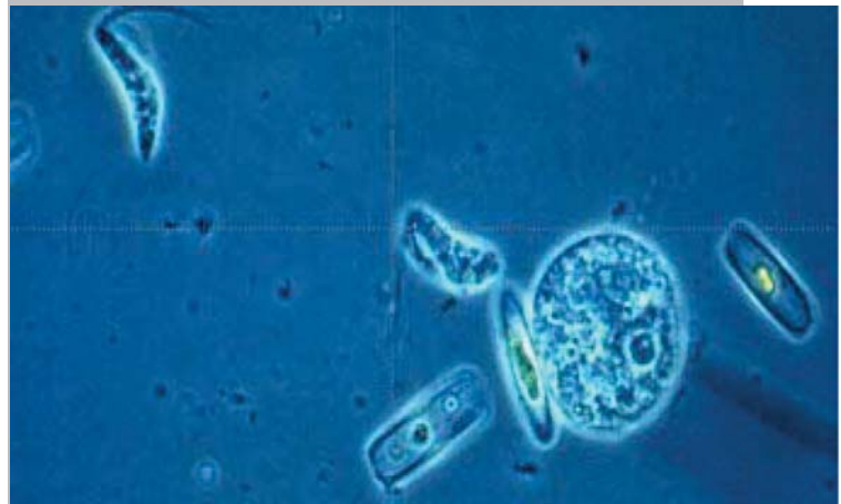
Extremófilos hallados en Río Tinto (arriba).

los que reconocen el parentesco del autor con el Darwin biólogo. Pero lo que de verdad me sorprendió en la supuesta relación entre