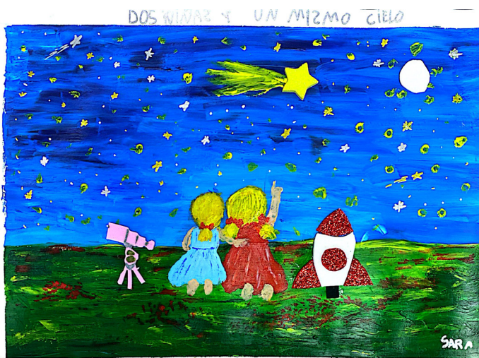
CAROLINA Y VALENTINA